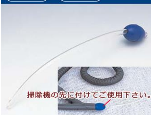
掃除機の先に付けてご使用下さい。

市販されているほとんどの掃除機に接続できます。お肉やお餅、パンなども簡単に吸い取れます。使い方は簡単。誰でも素早く救急処置ができます。